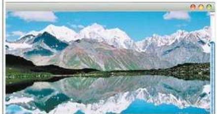
La montaña de Beluja se encuentra situada en la República de Altái. Con 4.500 metros es el punto más alto de Siberia. Sus habitantes lo consideran un lugar sagrado. rusiahoy.com/21607