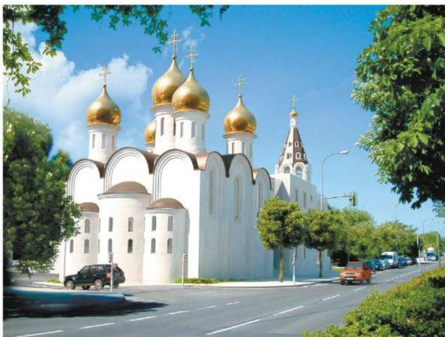
En marzo está previsto que se finalicen las obras de la que será la catedral rusa de Madrid .