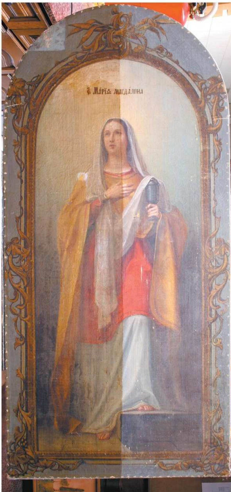
Imagen del retablo Santa María Magdalena de mitad del siglo XIX, procedente de Rosario (Argentina).