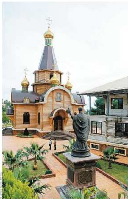
Las cúpulas de Altea rompen con el paisaje de la zona.

aportar dinero". Es más, el párroco se ha preocupado de que parte de los obreros que la levanten sean rusos, muchos de ellos afectados por la crisis del sector.