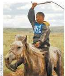
Un niño tuvano monta a caballo por la estepa asiática.

“¿En qué cree la gente en los tiempos que corren? En